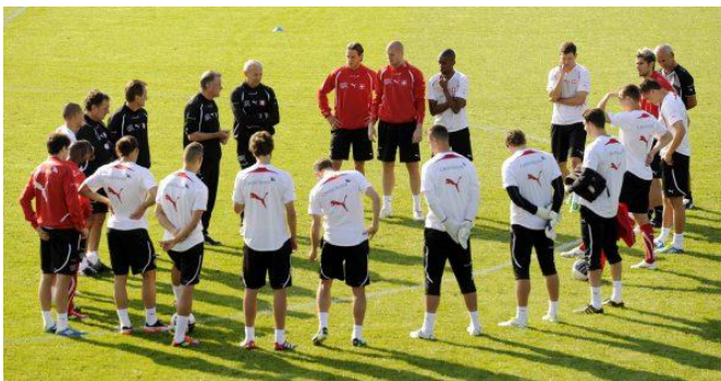
Mein Traum: Eine Mannschaft aus Besteller - Planer – Bau – Betrieb.

Die Digitalisierung (u.a. BIM) wird den Prozess von Planung, Bau bis Betrieb stark verändern. Ich sehe dies als Chance für einen neuen Wertschöpfungsprozess und eine integralere Zusammenarbeit. Protagonisten, Tools, neue Technologien und internationale Kunden sind die treibenden Kräfte.